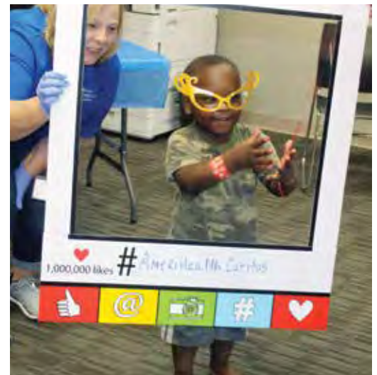
Un pequeño miembro de nuestro plan de salud divirtiéndose durante una visita reciente a nuestro Centro de bienestar comunitario de Shreveport.